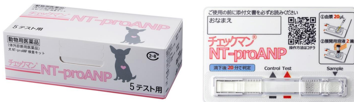
チェックマン NT-proANP 製品画像

犬血漿中の心臓バイオマーカーNT-proANP レベルの判定用検査キット。血漿中の NT-proANP レベルを少量の血漿にて約 20 分で簡易的に検出・判定することが可能です。基礎研究を含め 10 年以上にわたる開発期間を経て 2024 年 11 月から販売を開始。農林水産省の承認を得た動物用体外診断用医薬品であり、現在日本と中国で特許を取得しています。